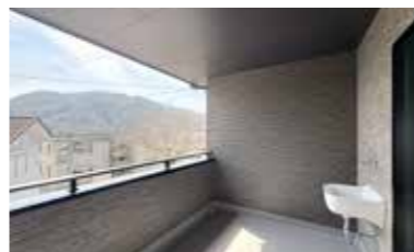
眺望の優れた広々バルコニー