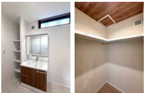
明るい洗面室 ウォークインクローゼット

Pickup No.3 付属土地付き企画 付属土地/564.00㎡(170.61坪) ドッグランや、遊具スペース等、 楽しみいっぱい。 駐車スペースも広々OK。