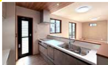
先進設備のキッチン