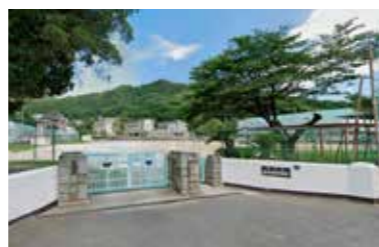
広中央中学校/徒歩6分