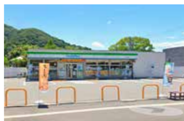
ファミリーマート

〈新築戸建2棟〉●土地105.67㎡(31.96坪)~105.68㎡(31.96坪)●建物106.52㎡(32.22坪)~111.66㎡(33.77坪)●R8年7月完成予定 他●確R07認広建セ01503号 他●呉市広中新開3丁目●弁天橋バ停歩3分●価格3,880万円●2戸●仲介